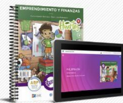
Epsilon, Bolsas de despensa