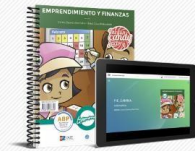
Gamma, Fun candy factory