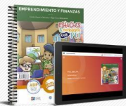
Delta, Estuches de PET