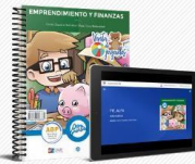
Alfa, Venta de juguetes